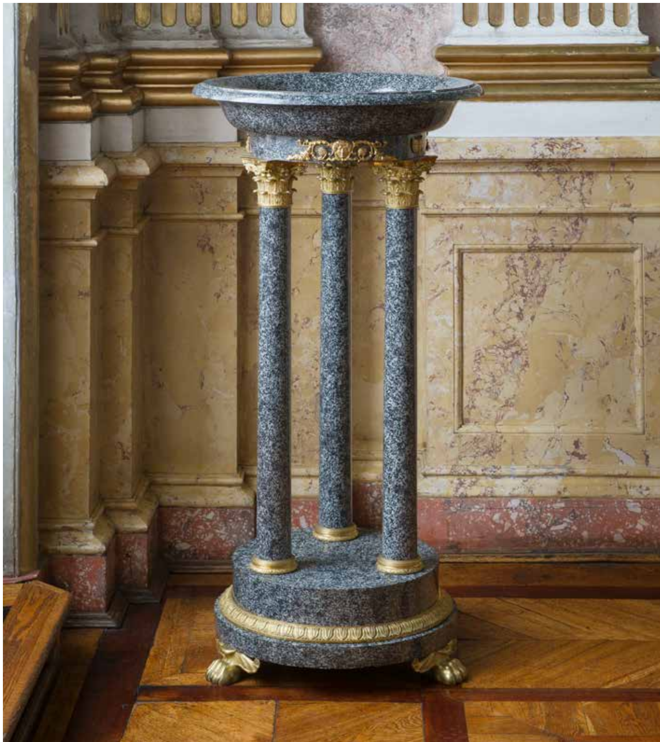
Ute på Rosendal står en identisk jardinjär av Åsbydiabas. Den som står på Stockholm slott är en gåva från prinsessan Ingeborgs (1878–1958) sterbhus. Modellen förekom i en priskurant från 1830-talet.