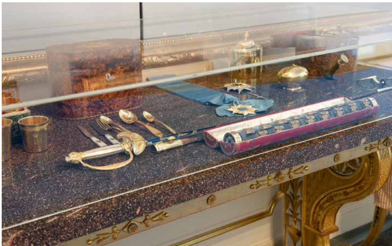
Detalj av konsolbord med kraftfull skiva av Blybergsporfyrr. På bordet återfinns Karl XIV Johans marskalksstav, värja och fältsilver.