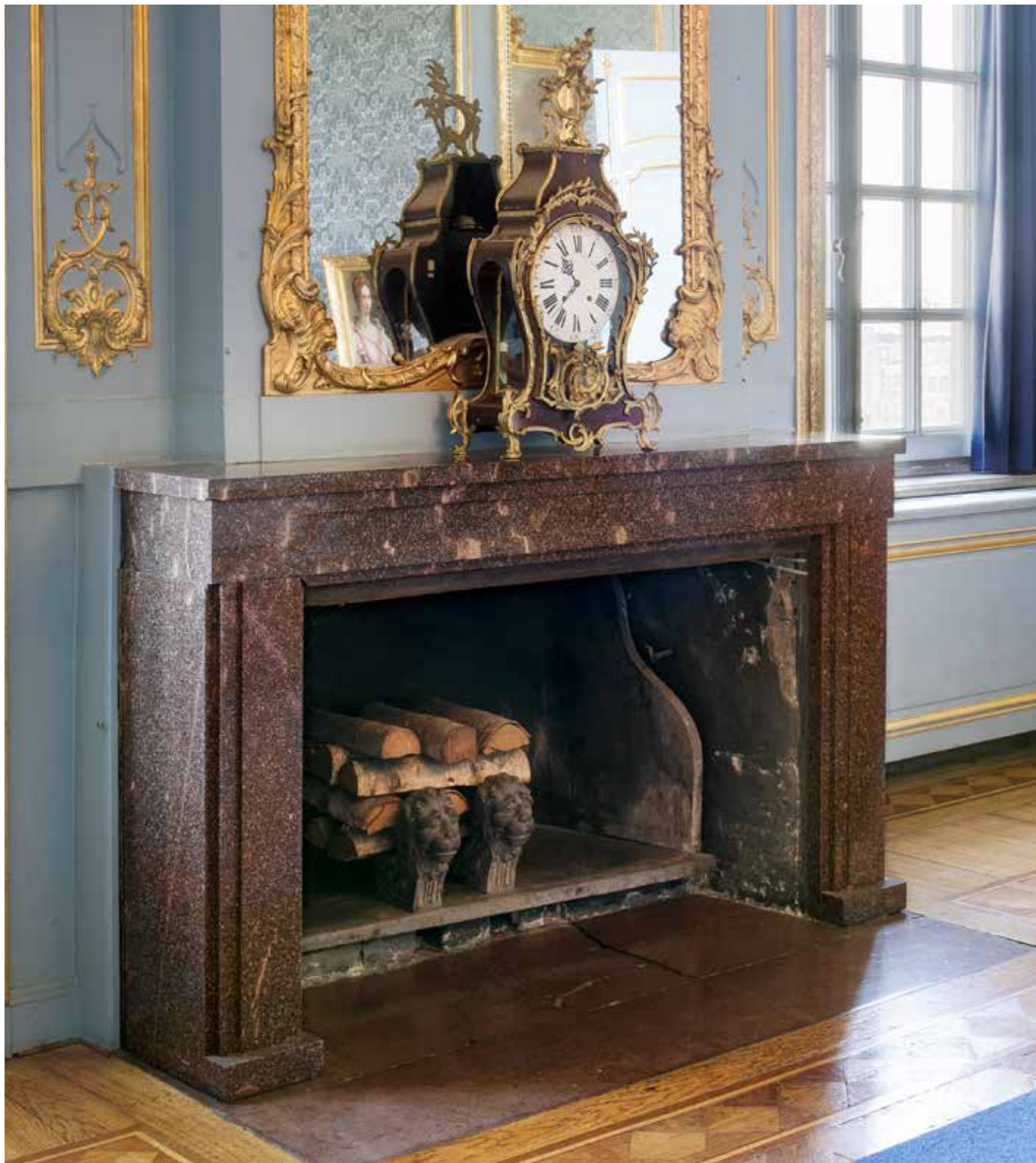
Spisomfattning av Blybergsporfy, beställd 1792 av Gustav III, nu i Blå salongen i Bernadottevåningen på Stockholms slott.