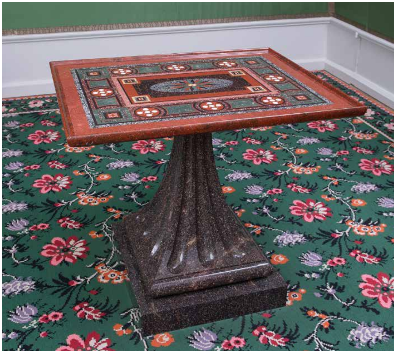
Karl XIV Johan beställde detta bord i Älvdalen. Bibliotekskabinettet på Rosendal.