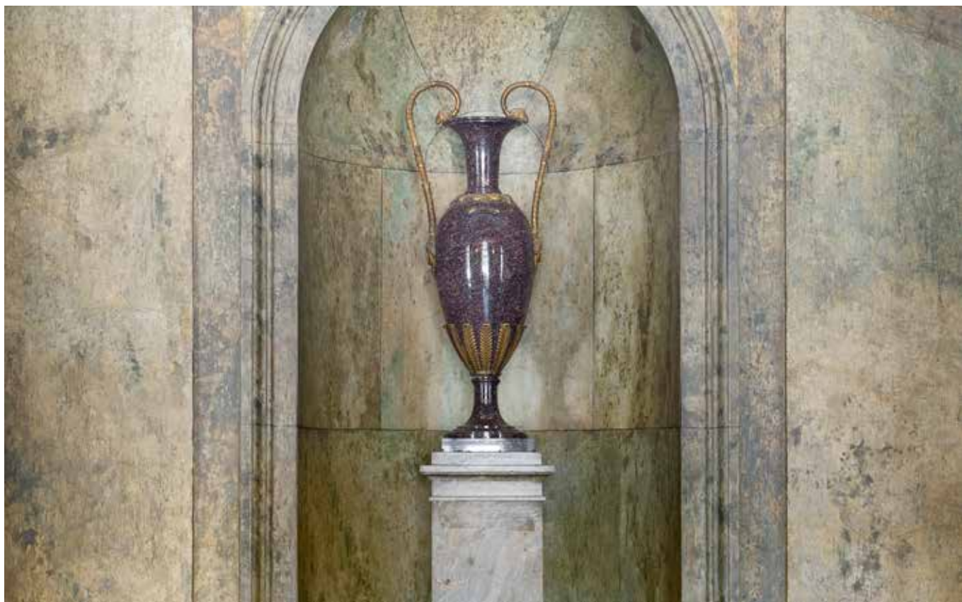
Vas av Blybergsporfyrr, västra trapphuset, Stockholms slott. Efter förlaga av bronsgjutaren och hovciselören Fredrik Ludvig Rung (1758–1837).

När statschefen tar emot nyanlända ambassadörer i högtidlig audiens sker det i Östra åttkantiga kabinettet i det som idag kallas Bernadottevåningen på Stockholms slott. Det lilla rummet utgör en av de elegantaste och bäst bevarade rokokointeriörerna på slottet. Någon gång under 1900-talet har två imponerande äggformiga vaser av Blybergsporfyrr med svenska bronsmonteringar, sannolikt av hovciselören Fredrik Ludvig Rung, placerats i innerväggens nischer. Porfyrvasernas hårda blanka yta med sina gyllene orneringar skapar en kontrastverkan mot den fasta inredningen vilket bidrar till att ge tyngd och ytterligare höja det redan högklassiga rummets dignitet. I motsvarande rum i Bernadottevåningens västra del står två måhända än mer imponerande amforaformade porfyurnor med schvungfulla hänklar i