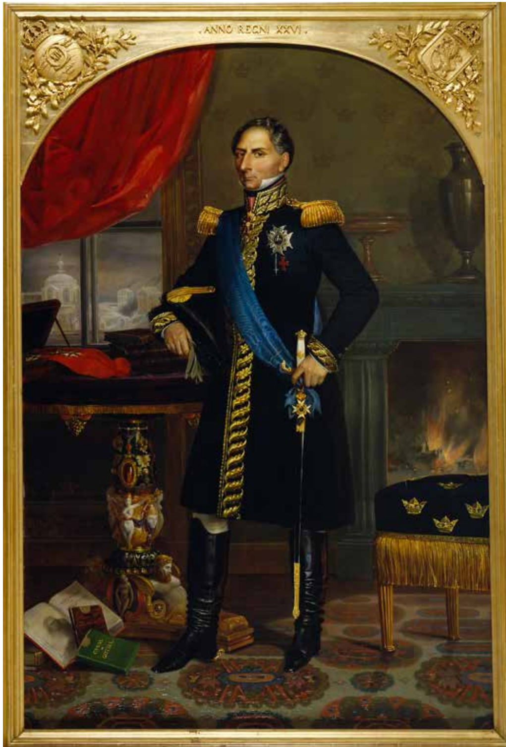
Porträtt av Karl XIV Johan, notera vassen och skålen av Älvdalsporfyr på spisen. Oljemålning av Emile Mascré 1843.